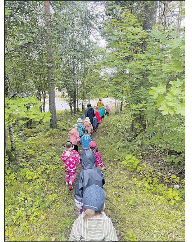
Luonto tarjoaa Omenapuun lapsille elämyksiä ja oppimista.

lulaisten siirtyessä koulutiel-le. Tämä mahdollistaa uusien lasten pääsyn osaksi Ompun lämminkistä yhteisöä. Jos tiedät tarvitsevasi paikkaa,