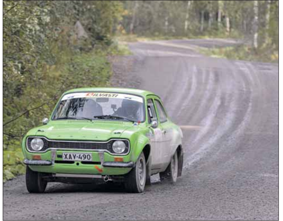
Sami Vuorinen - Esa Kirjonen ovat hyvässä syysvireessä.