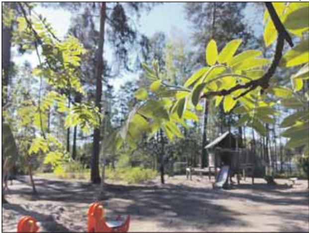
Avoimien ovien päivänä voit tutustua päiväkodin tiloihin, pihaan ja arkeen.

RENGASTYÖT JA TUULILASIN VAIHDOT JA KORJAUKSET