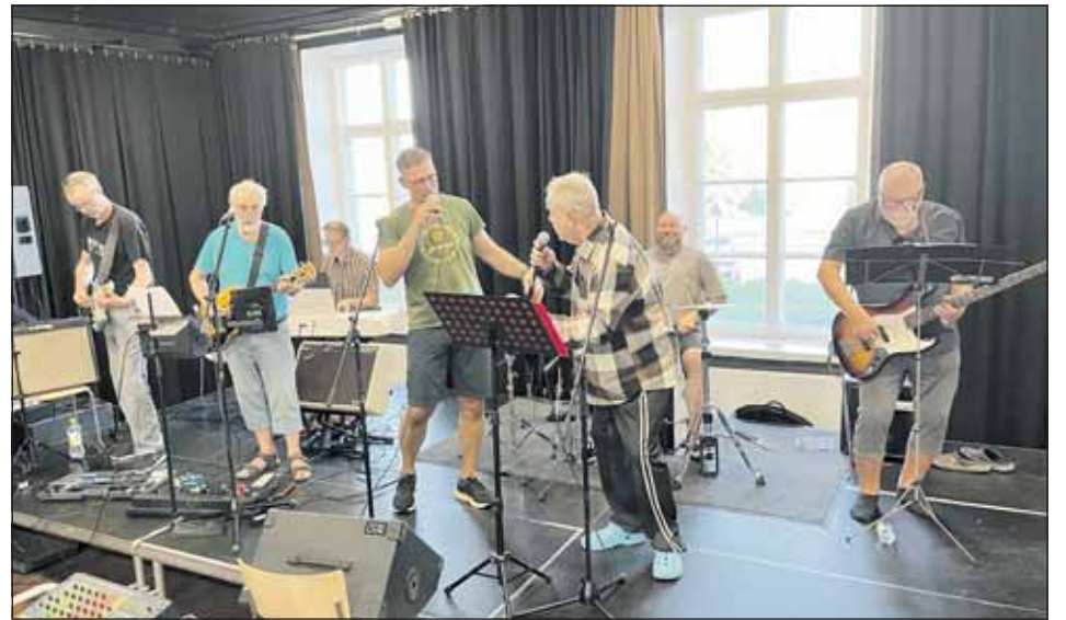
Kuva Mäntsälä Live

Juhlakonsertti alkaa lauantaina 6.9. klo 18 Mäntsälän Suurlavalla, Maisialantie 7. Ovet avautuvat klo 17. Liput 20 euroa ennakkoon Kipa-kirjakauppa Mäntsälä ja lippu.fi.