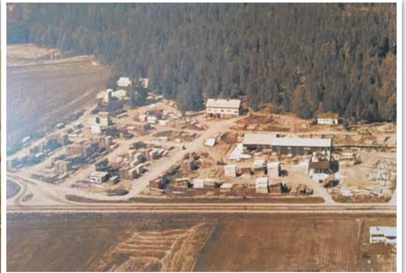
Mäntsälän Saha Oy:n aluetta 1968.