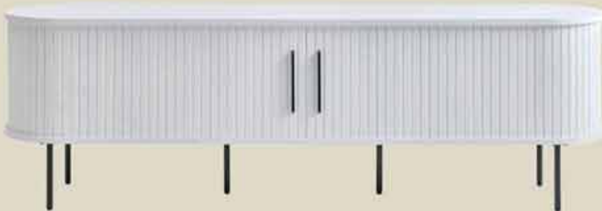
Esim. Nola tv-taso 180 cm.

Valkoiset Nola-sarjan tuotteet erikoishinnoin jopa -50%