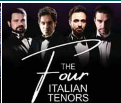
Ma 18.5. THE FOUR ITALIAN TENORS