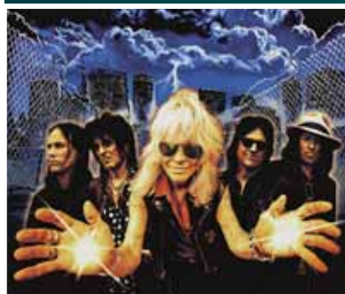
To 7.5. MICHAEL MONROE Outerstellar Tour 2026