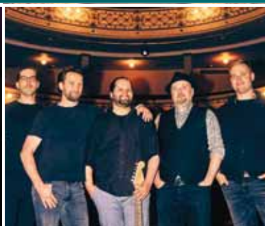
Pe 22.5. ALCHEMY Finnish Tribute to Dire Straits