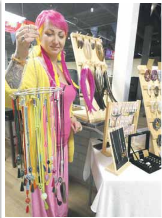
Mirakorun värikkäät aidoista kivistä ja sulista tehdyt korut herättivät huomiota.