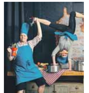
Company Kate &amp; Pasi.

Yhteistyössä on voimaa, ja kunnan eri toimijat te-