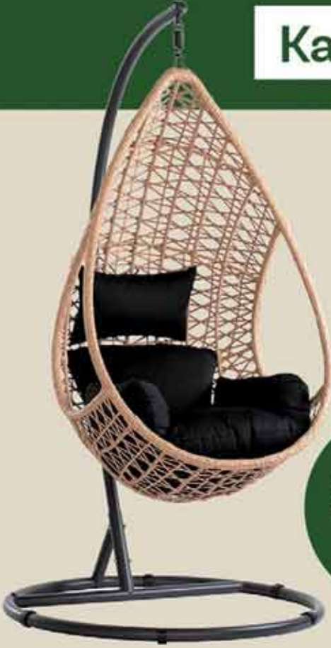
Suvi riippukeinu pisara.

Kaikki puutarhakalusteet -30%, jopa -50%