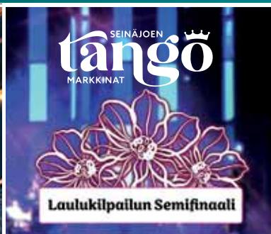
La 23.5. Tangomarkkinat Semifinaali