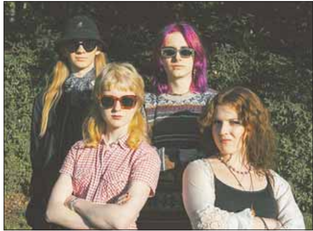
Punkbändi Jaanat esiintyy Kulttuurimeijerillä.

Illan kruunaa klo 19 heli-sinkiläinen värikkäitä säveliä soittava punk bändi Jaanat.