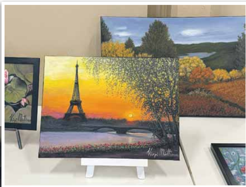
Virpi Miettinen maalaa miehellään kauniita maisemia.