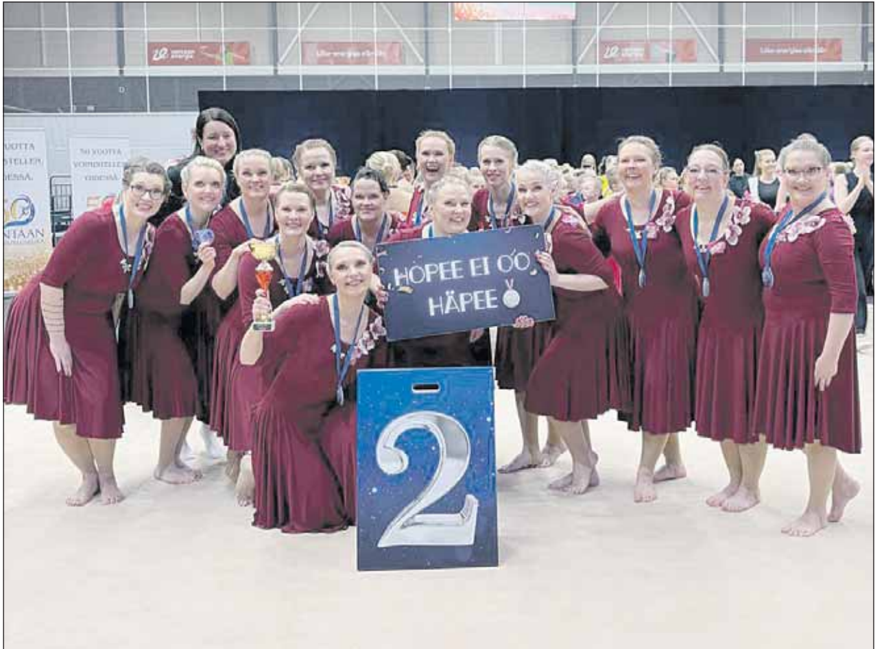
Hengettäret-joukkue toi kotiin tuplahopeaa tanssillisen voimistelun cup-kilpailusta.

Kevätkausi ei suinkaan loppu mestaruuskilpailuihin, vaan joukkue suuntaa yhdessä muun seuraväen kanssa Joensuun Suomi Gymnastrada -suurtaapahtumaan 4.-7.6. Hengettäret osallistuu kenttäohjelmiin sekä esiintyy perjantaina kilpailuohjelmallaan jäähallinäytöksessä, joka televisoidaan YLE:n toimesta.