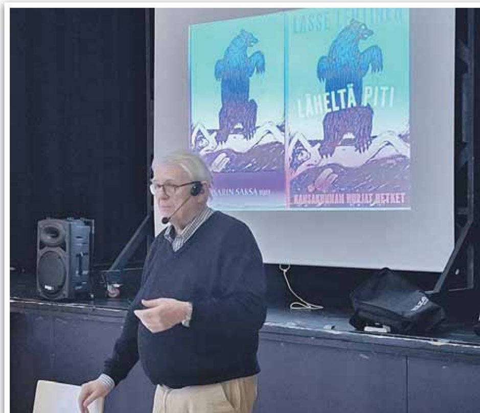
Kirjailija, toimittaja ja entinen poliitikko Lasse Lehtinen esitteli uusinta kirjaansa tilaisuudessa.