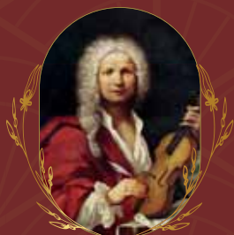
A. VIVALDI (1678–1741): Gloria, RV 589