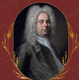
G. F. HÄNDEL (1685–1759): osia Messias-oratoriosta HWV 56