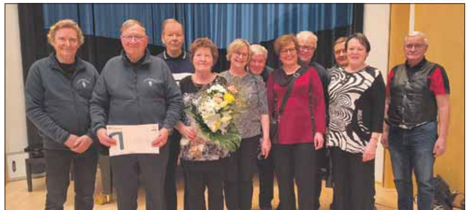
Vuoden 2025 hyvinvointiteko on Karaoketanssit-toiminta.